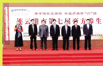
10月28日, 连云港市第七届膏方养生节在我院盛大开幕