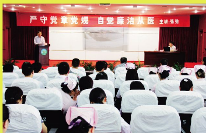
8月30日, 我院邀请市纪委派驻卫计委第七纪检组组长张弛作“严守党章党规自觉廉洁从医”专题讲座