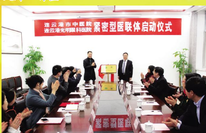
12月15日, 我院与连云港光明眼科医院签订共建紧密型医联体合作协议