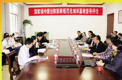
4月26日, 我院接受国家级中医医院医师规培基地督导评估, 并顺利获批准