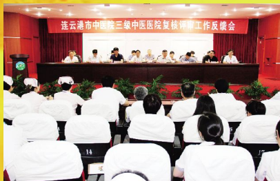
7月3日—4日, 我院接受三甲复评, 并顺利通过评审