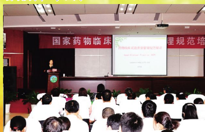
2017年, 我院全力推进国家药物临床试验质量管理规范(GCP)认证工作