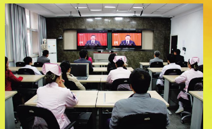
10月18日, 党十九大在北京胜利召开, 我院组织集中收看大会开幕式盛况