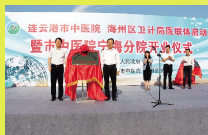
9月1日, 市中医院宁海分院隆重揭牌