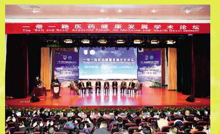
12月6日, 我院与南医大康达学院共同举办“一带一路”医药健康发展学术论坛