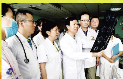
12月29日, 脑病科顺利通过江苏省“十二五”中医药重点学科建设验收答辩