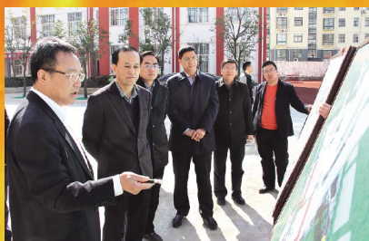
3月8日, 市政府黄远征副市长视察调研我院新院区改扩建工程现场