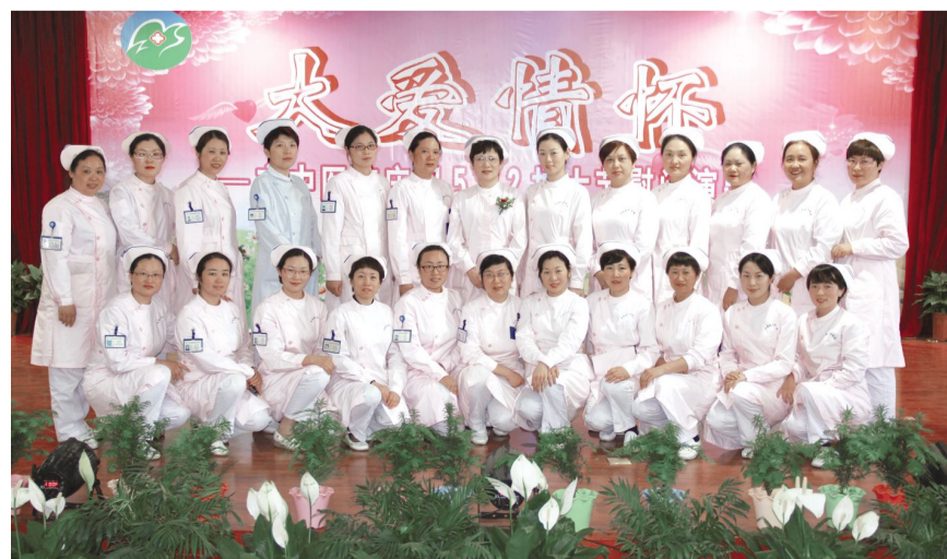
优秀的护士长管理团队

优质护理服务不仅在院内蓬勃开展,我院还将之向外不断延伸,患者即使已经出院,还会接到护士们的电话回访和家庭访视。此外我院的护理团队不定期至周边的街道社区,为社区居民提供免费的用药指导、健康教育、慢性病管理等服务,她们还把居民们请到医院里来,相继打造出了“糖尿病之家”、“肾友之家”、“脑卒中俱乐部”、“孕妇学校”、“心血管之家”等品牌活动,从而实现了护理服务对人群的全覆盖。(顾豪 封爱婷)