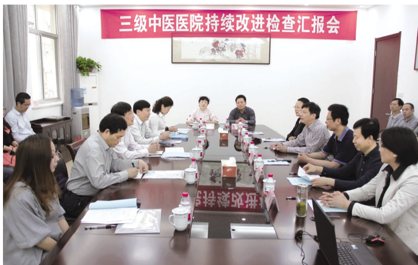
三级中医医院持续改进检查汇报会